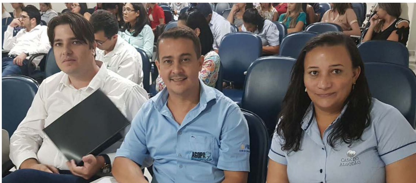
Equipe do Programa ABR Goiás está atenta às mudanças na lei para orientar produtores

A equipe do Programa ABR Goiás esteve presente no curso sobre a Reforma Trabalhista, realizado em Rio Verde (GO). O objetivo foi atualizar os participantes acerca das mudanças implantadas pela Reforma Trabalhista, publicada no Diário Oficial da União no dia 13 de julho de 2017, através da lei 13.467/2017, que alterou o cenário das relações do trabalho entre empregadores e empregados. A regulamentação da terceirização; do trabalho