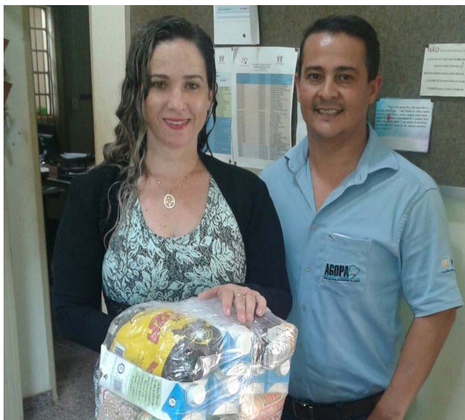
Doação de cesta básica é feita mensalmente

famílias de reeducandas do sistema prisional que possuem filhos. A Agopa acredita que é papel de todos contribuir para a construção de uma sociedade mais justa e menos desigual.