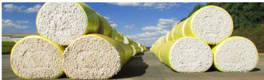
Após a colheita, é hora de beneficiar o algodão. O selo ABR-BCI garante a procedência do fardo.

Lançado no final de 2012 pela Associação Brasileira dos Produtores de Algodão (Abrapa), o Programa Algodão Brasileiro Responsável (ABR) representa a síntese da união dos cotonicultores brasileiros em prol de uma melhor produção em todo país. Financiado pelo Instituto Brasileiro do Algodão (IBA), o programa tem adesão voluntária dos produtores